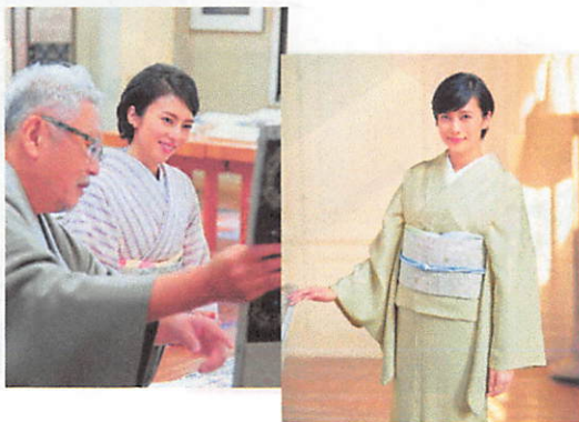
2016年美しいキモノ冬号より

2016年 冬号「美しいキモノ」でも紹介 特集「柴咲コウさんのお誂え旅コーナー」 織楽浅野さんの工房を訪ね袋帯をお誂え